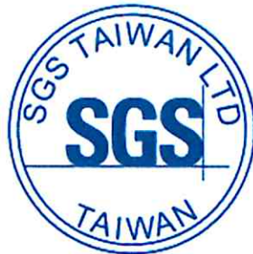
吳偉銘 / 副理 台灣檢驗科技股份有限公司 報告簽署人

此報告是本公司依照背面所印之通用服務條款所簽發，此條款可在本公司網站 http://www.sgs.com.tw/Terms-and-Conditions 閱覽，凡電子文件之格式依 http://www.sgs.com.tw/Terms-and-Conditions 之電子文件期限與條件處理。請注意條款有關於責任、賠償之限制及管轄權的約定。任何持有此文件者，請注意本公司製作之結果報告書將僅反映執行時所紀錄且於接受指示範圍內之事實。本公司僅對客戶負責，此文件不妨礙當事人在交易上權利之行使或義務之免除。未經本公司事先書面同意，此報告不可部份複製。任何未經授權的變更、偽造、或曲解本報告所顯示之內容，皆為不合法，違犯者可能遭受法律上最嚴厲之追訴。除非另有說明，此報告結果僅對測試之樣品負責。